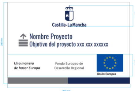
Tipografía Proyecto: Oswald Regular. Pantone: 295 C Tamaño 54 puntos, interlineado 66 puntos.