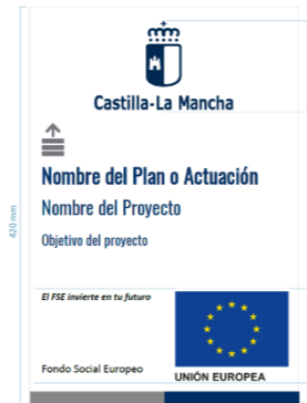
Tipografía Proyecto: Oswald Regular. Pantone: 295 C Tamaño 54 puntos, interlineado 66 puntos. Tipología Objetivo: Oswald Regular. Pantone: 295 C Tamaño 48 puntos, interlineado 56 puntos.

Si hubiera que incluir logotipos de otros organismos participantes, éstos se ubicarán a la izquierda del logotipo y referencia de la Unión Europea