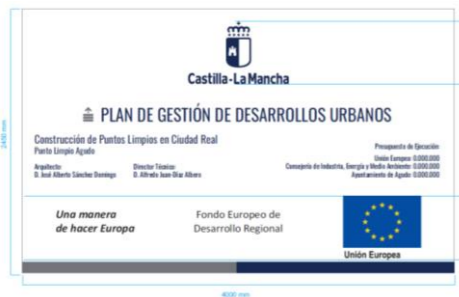
Tipografía del "PLAN DE GESTIÓN...": Oswald Regular. Pantone 295 C, tamaño 450 puntos.