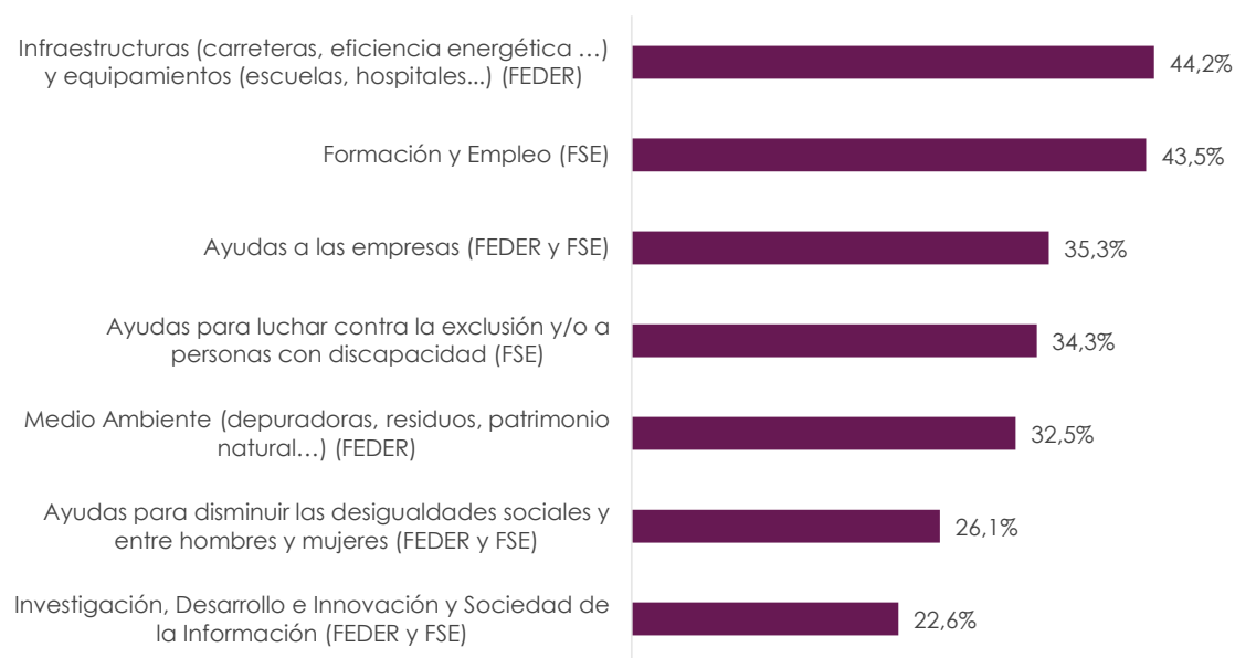
Tabla 5 GRADO DE CONOCIMIENTO DE LOS PROYECTOS O INVERSIONES REALIZADAS POR AMBOS FONDOS